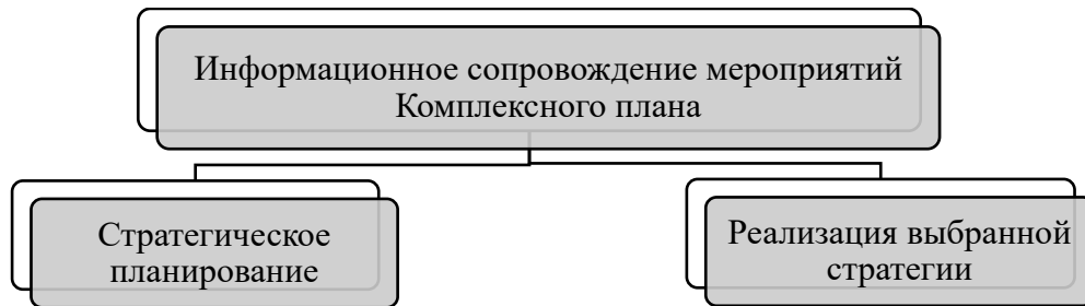
Рисунок 2 – Планирование информационного сопровождения мероприятий Комплексного плана

Основные принципы информационного сопровождения мероприятий Комплексного плана основываются на базовых принципах: