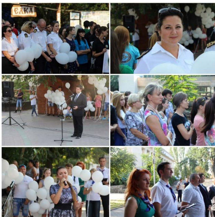
Рисунок 6 – Фоторепортаж митинга в День солидарности борьбы с терроризмом в официальной группе НЦПТИ "vk.com/ncpti_rnd"

5. Заключительный пресс-релиз с комментариями участников – размещается в день завершения мероприятия или на следующий день.