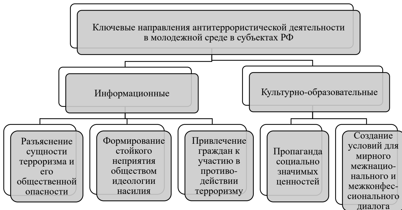
Рисунок 1. Ключевые направления антитеррористической деятельности

Перечисленные выше направления реализации Комплексного плана предполагают следующие форматы проведения мероприятий: